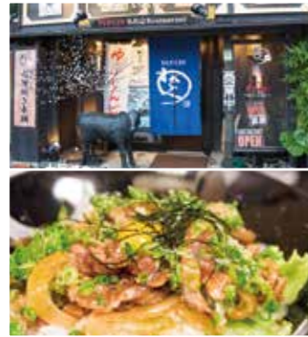
七輪焼き 和作 大分県由布市湯布院町川上3064-4 TEL: 0977-85-2848 17～23時(L.O 22時半) 定休/木曜

オリジナル商品も6百点を数える。人気なのは亀の井別荘で受け継がれてきた味をパッケージ化した「家伝商品」。「伽羅露」は半年間塩漬けした山露をボイルし一昼夜かけて塩抜きし天日干し。無添加醤油や唐辛子・山椒等で炊き上げ、独特の風味に仕上げた佃煮だ。ご飯やお酒のお供にどうぞ。「柚子煉り」「寒餅あられ」などお土産で喜ばれるものが揃っている。家で使った気に入った人にはオンラインショッピングもある。店内で手作りする「おはぎ」も早い時は昼前に売り切れてしまう人気商品。朝8時から夜8時まで開いている、旅行者に優しいお店だ。