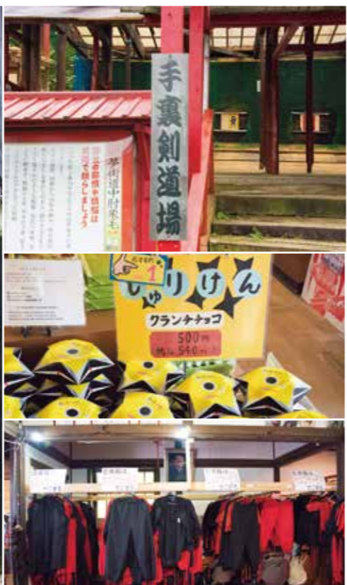
元祖忍者村 嬉野温泉 肥前夢街道 佐賀県嬉野市嬉野町大字下野甲 716-1 TEL : 0954-43-1990 土日祝 / 9～17時 平日 / 9～16時