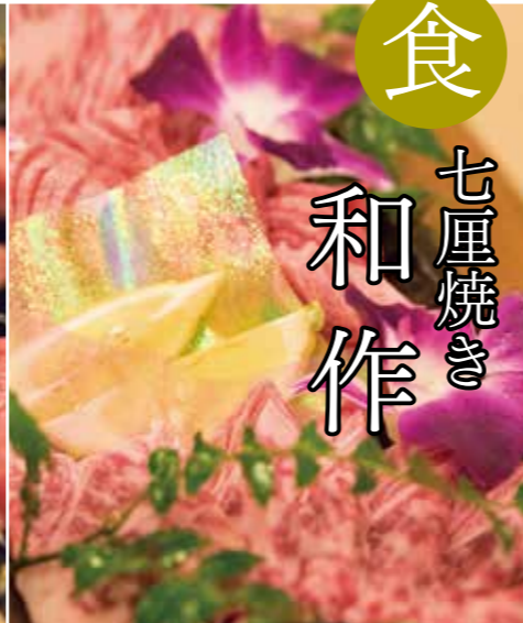
食 七厘焼き 和作