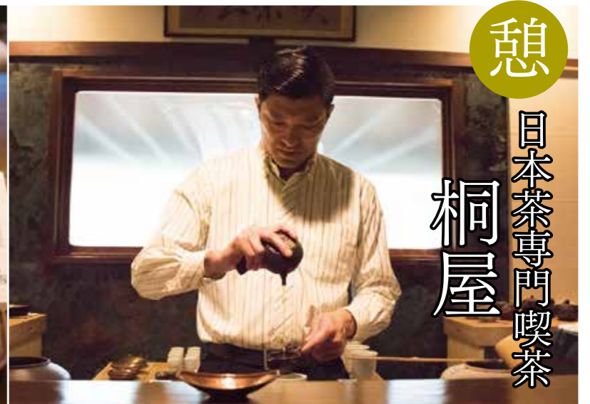
憩 日本茶専門喫茶 桐屋