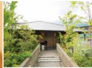
日本料理 山椒郎 大分県由布市湯布院町川上田中2850-5 TEL: 0977-84-5315 11～14時半(閉店15時)、 18～21時(閉店22時) 定休水曜(GW・盆時期・年末年始は営業)