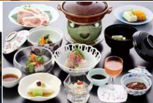
嬉野温泉 大正屋 佐賀県嬉野市嬉野町下宿乙 2276-1 TEL : 0954-42-1170