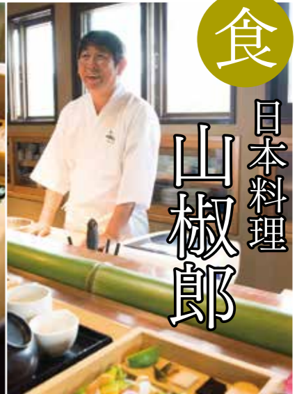
食 日本料理 山椒郎