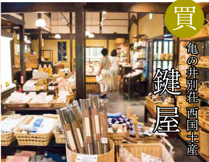
買 亀の井別荘 西国土産 鍵屋