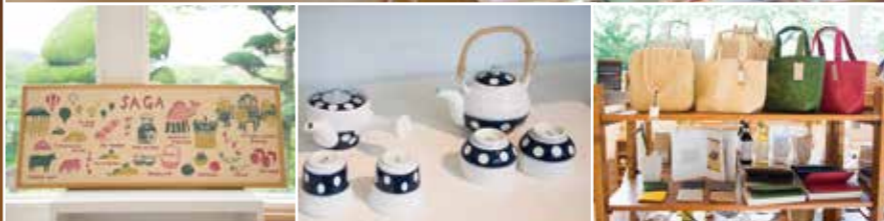
café&shop KiHaKo 嬉箱 佐賀県嬉野市嬉野町大字岩屋川内甲 379 TEL : 0954-42-0026 9時半～21時 (火・不定20時close)

と損。」という挑戦的なキャッチフレーズで打って出るのは「元祖忍者村 嬉野温泉肥前夢街道（入園料・中学生以上千円、3歳から小学生600円）。」いつの間にか、忍者軍団に占領され、海外からのお客さんに大人気のテーマパークとなっている。