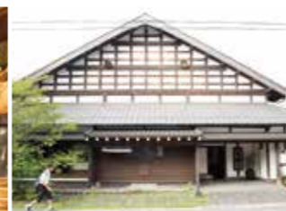
日本茶専門喫茶 桐屋 大分県由布院温泉川南113-12 TEL: 0977-28-8113 平日11～14時、15～17時(喫茶) 土日・連休/11～15時、 17～20時 定休/水曜