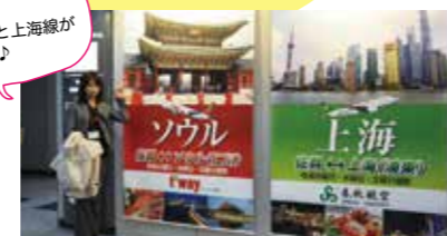
佐賀からソウル線と上海線があります♪

ソウル線と上海線にはニューオープン国際線専用施設から。空港内での移動も分かりやすいので出国手続きもラクラク。