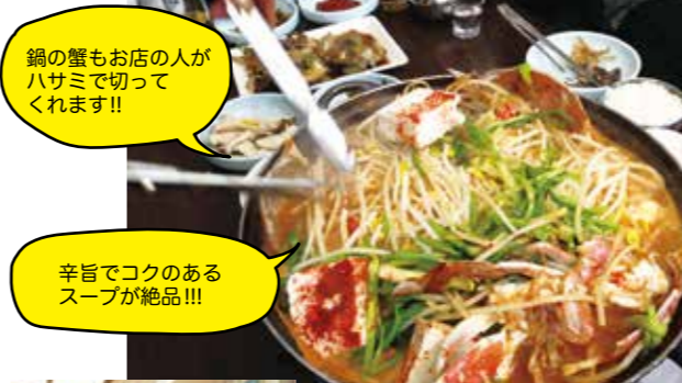
鍋の蟹もお店の人がハサミで切ってくれます!!