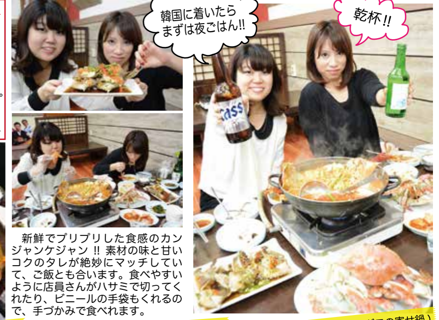
韓国に着いたらまずは夜ごはん!!