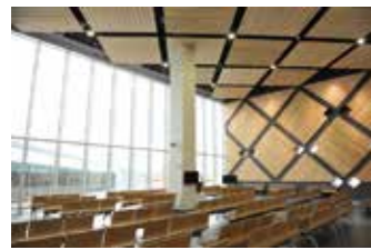
広々とした国際線ビル搭乗待合室。