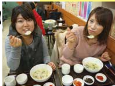
多味アワビのお粥 15,000W