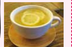
はちみつレモンティー *6,500W ビタミンたっぷりのはちみつレモンティーをホットで。