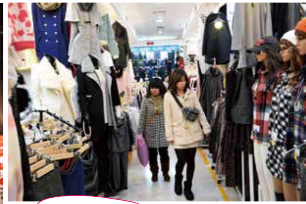
店がいっぱいで楽しい!!