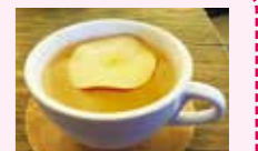
アップルティー *6,500W 爽やかなリンゴの味と香りをそのまま味わえる。