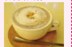
マルチグレインラテ *7,000W 12種類の健康ラテ。雑穀のつぶつぶが自然な甘さ。