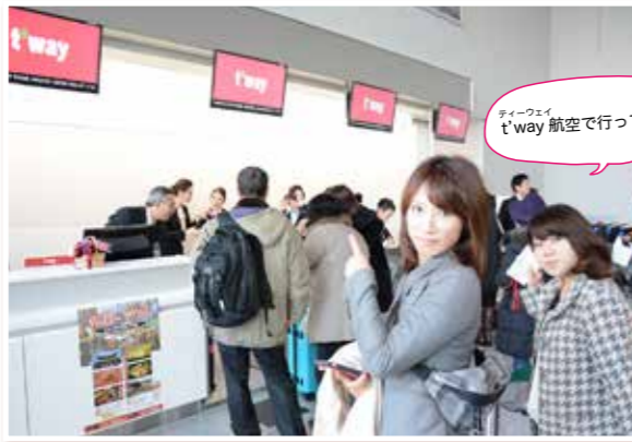
「t'way」航空で行ってきます♪