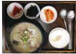
参鶏湯 (サムゲタン) 12,000W