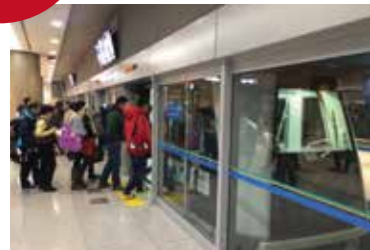
搭乗口までは電車で移動。引き返すことができないので要注意!!