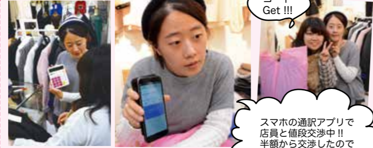
スマホの通訳アプリで店員と値段交渉中!! 半額から交渉したのでかなりお得でした♡