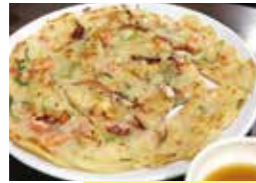
チヂミなどサイドメニューも豊富!