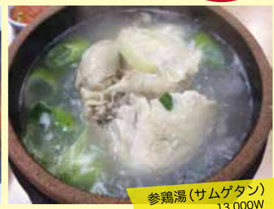
参鶏湯 (サムゲタン) 13,000W