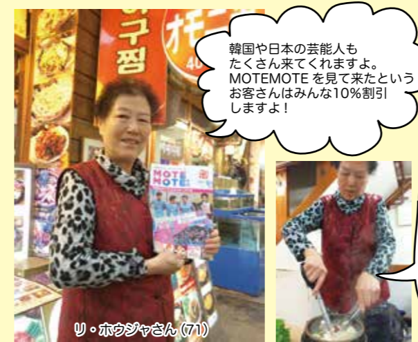
韓国や日本の芸能人もたくさん来てくれますよ。MOTEMOTEを見て来たというお客さんはみんな10%割引しますよ!