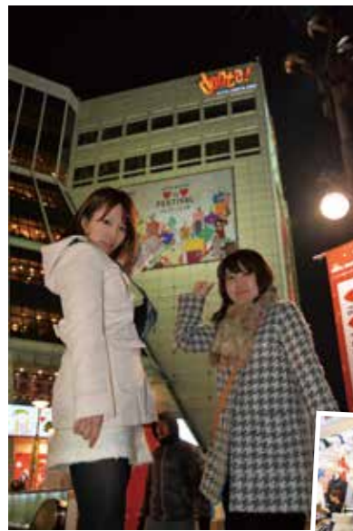
doota! は、フロア別にレディース、メンズ、バッグ、靴、小物、子供服と分かれています。