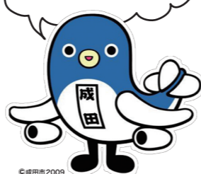
成田市観光キャラクター うなりくん