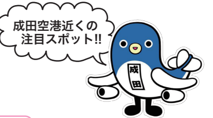
成田空港近くの注目スポット!!