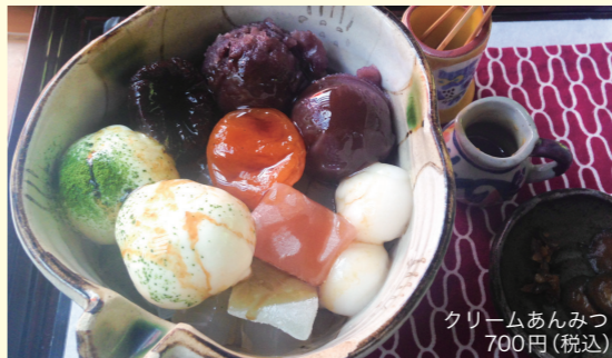
クリームあんみつ 700円(税込)

参道沿いの細い道を抜けて訪れる三芳屋。和の空間に癒されながら、甘味をいただけます。飲み物メニューも充実。成田観光館の目の前にあります。