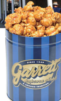
garrett popcorn shops ギャレットポップコーンショップス

人気のベルギーチョコレートのセカンドラインがアウトレットに初出店。包装やオリジナルバッグなどのデザインもおしゃれで、贈り物にもおすすめです。チョコレートを使ったシェイクなどテイクアウトメニューもあり。