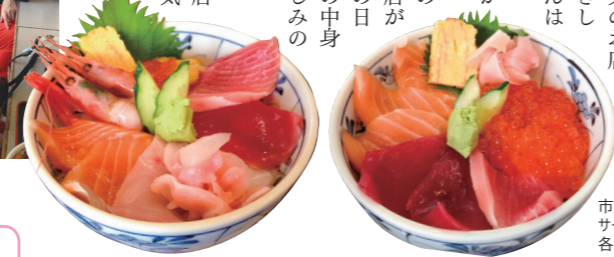
市場海鮮丼 サーマンクラ丼 各¥1,500

豊洲への移転が間近の築地市場。市場なので朝は早く、午前3時から営業のお店もあるので早起きして贅沢な朝ごはんはどうでしょう。地下鉄で築地駅か築地市場駅で降りれば、すぐ目の前に場外市場の店が軒を連ねる。その日の仕入れでネタの中心が変わるのも楽しみのひとつ。寿司や、ラーメン、和食、洋食など幅広い店があるので、お気に入りの店を見つけてみては。