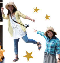
編集部 女子 おすすめ