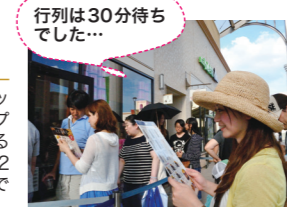
行列は30分待ちでした...

成田空港のフライトインフォメーションがあり、フライトまでの待ち時間をここで過ごすにはとても便利。アウトレットで思わず買いすぎてしまおう!! JR酒々井駅/京成酒々井駅が最寄り駅。東京駅からは高速バス成田空港からシャトルバスも運行。