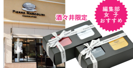
PIERRE MARCOLINI ピエールマルコリーニ

人気のベルギーチョコレートのセカンドラインがアウトレットに初出店。包装やオリジナルバッグなどのデザインもおしゃれで、贈り物にもおすすめです。チョコレートを使ったシェイクなどテイクアウトメニューもあり。