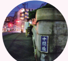
東京スカイツリーのライティングは日没~23:00まで。事前にHPで確認すると確実です。

隅田川と回中川を結ぶ北十間川に架かる小さな橋。東京スカイツリーの姿と北十間川に逆さに写る「逆スカイツリー」の両方が見られることで、有名な撮影スポットになっています。駅から徒歩5分。下町の商店街を散策しながら撮影ポイントを探してみるのもおすすめです。