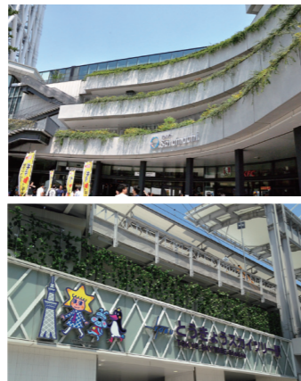
東京スカイツリーは押上駅かとうぎょうスカイツリー駅が最寄り駅