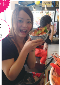
女子的 おすすめポイント

豊洲への移転が間近の築地市場。市場なので朝は早く、午前3時から営業のお店もあるので早起きして贅沢な朝ごはんはどうでしょう。地下鉄で築地駅か築地市場駅で降りれば、すぐ目の前に場外市場の店が軒を連ねる。その日の仕入れでネタの中心が変わるのも楽しみのひとつ。寿司や、ラーメン、和食、洋食など幅広い店があるので、お気に入りの店を見つけてみては。