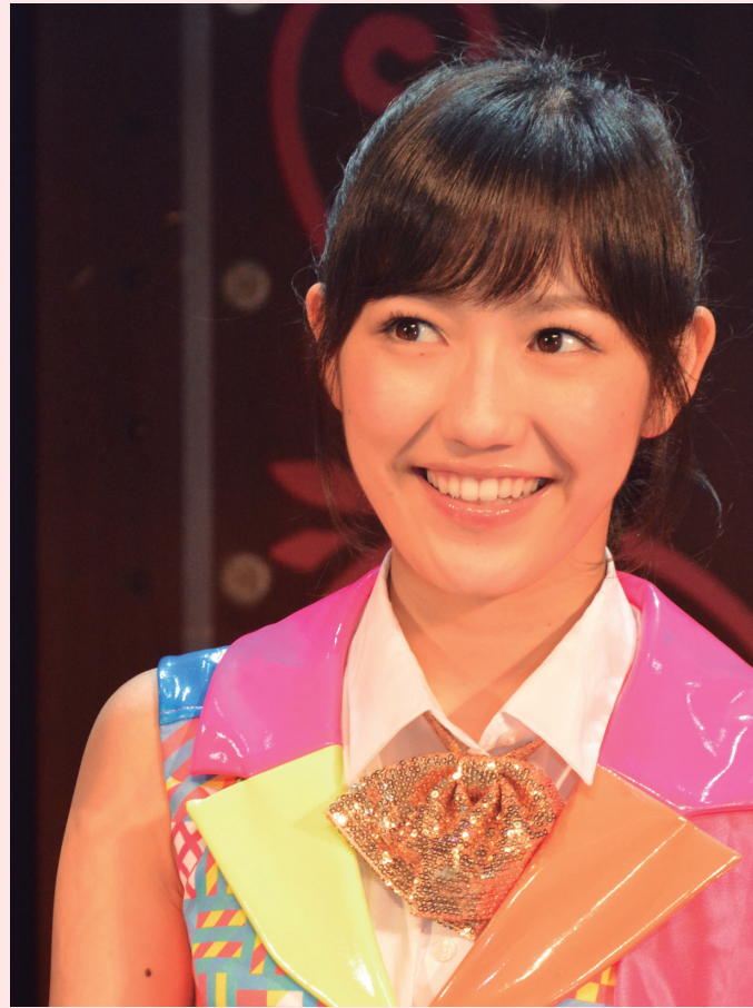
渡辺 麻友 Mayu Watanabe