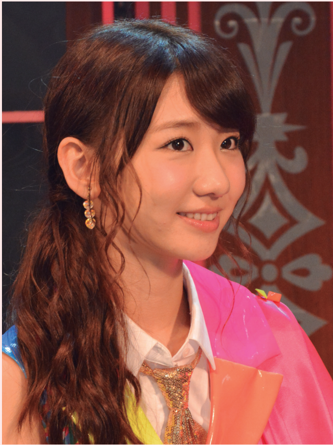
柏木 由紀 Yuki Kashiwagi